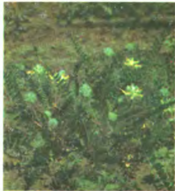
124. Астрагал шерстистоквітковий.